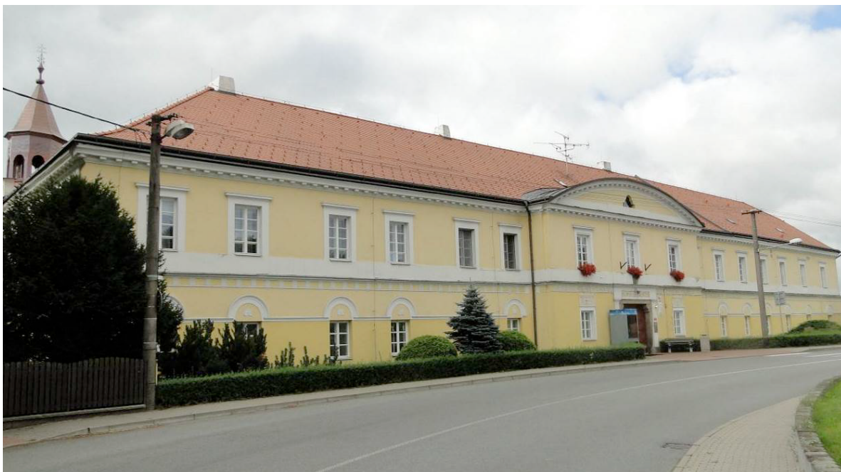
Obr. 1. Zámek ve Věži – hlavní severní průčelí.