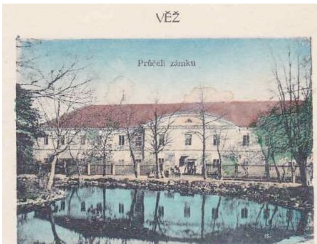
Obr. 2. Zámek ve Věži – historická fotografie hlavního, severního průčelí.