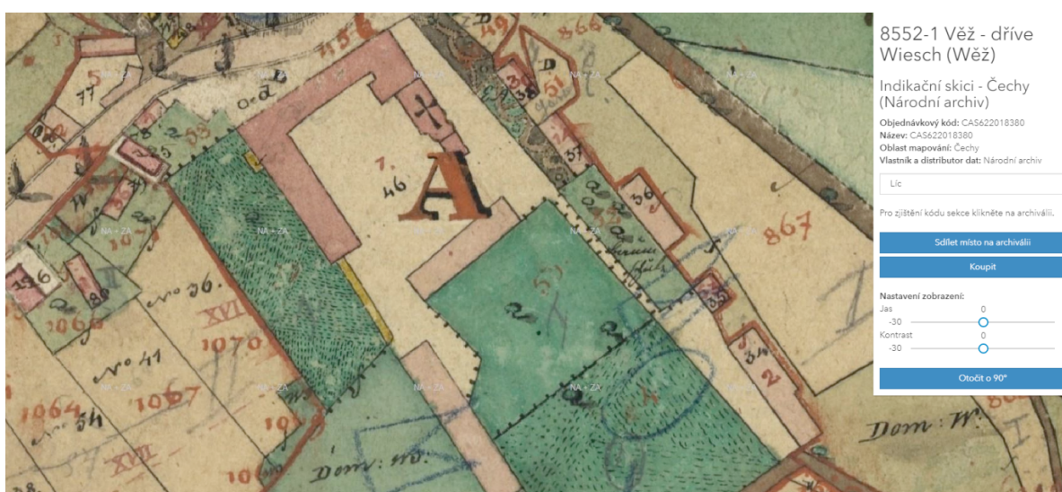
Obr. 4. Areál zámku na mapě Stablního katastru.