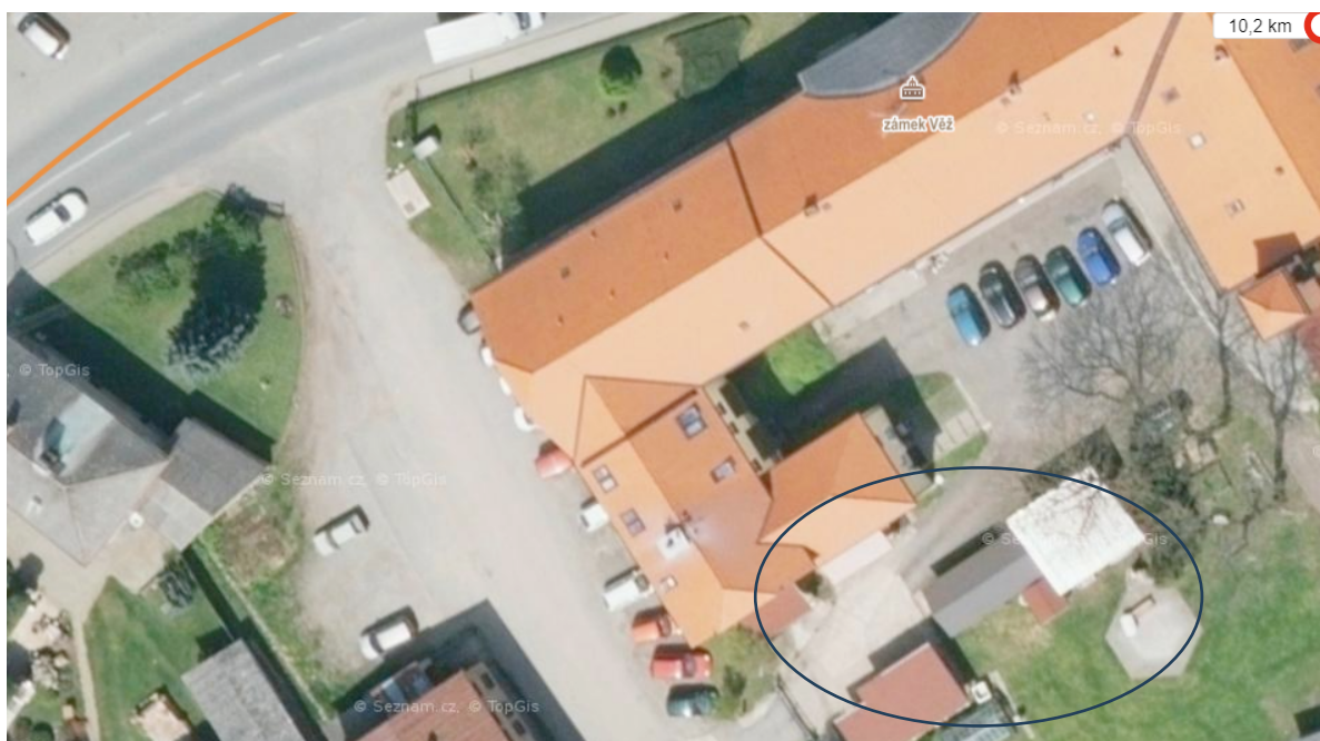
Obr. 3. Zámek ve Věži – letecký pohled na střešní rovinu střechy hlavního objektu, v minulosti provedenou vestavbu v západním křídle a předmětný jižní prostor.